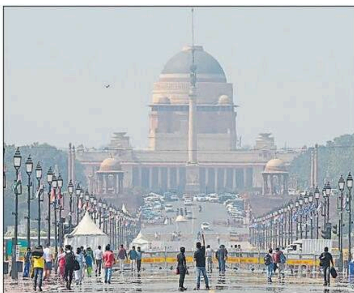
दिल्ली के कर्तव्यपथ पर बुधवार को धूप के बीच ठहलते पर्यटक।

नई दिल्ली, प्रमुख संवाददाता। राजधानी में शुक्रवार और शनिवार को बारिश होने के बाद एक बार फिर मौसम में बदलाव देखने को मिलेगा। दिल्ली में अधिकतम एवं न्यूनतम तापमान में गिरावट आएगी और एक बार फिर ठंड का पहरास होगा। इसके लेकर मौसम विभाग ने येलो अलर्ट जारी किया है। राजधानी में बीते कुछ दिनों से सामान्य तापमान बना हुआ है। सुबह-शाम हल्की ठंडक है। वहीं, दिन में धूप निकल रही है। बुधवार को दिल्ली का अधिकतम तापमान 25.5 डिग्री दर्ज किया गया। न्यूनतम तापमान हल्की गिरावट के साथ 10.7 डिग्री दर्ज किया गया। वहीं, शुक्रवार को बारिश के चलते अधिकतम तापमान में लगभग चार डिग्री की कमी देखने