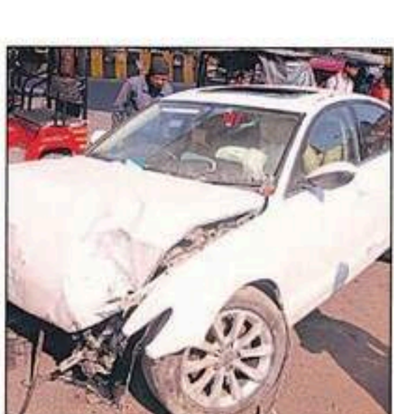
नोएडा में बुधवार तड़के ऑडी कार शौचालय की दीवार से टकरा गई।