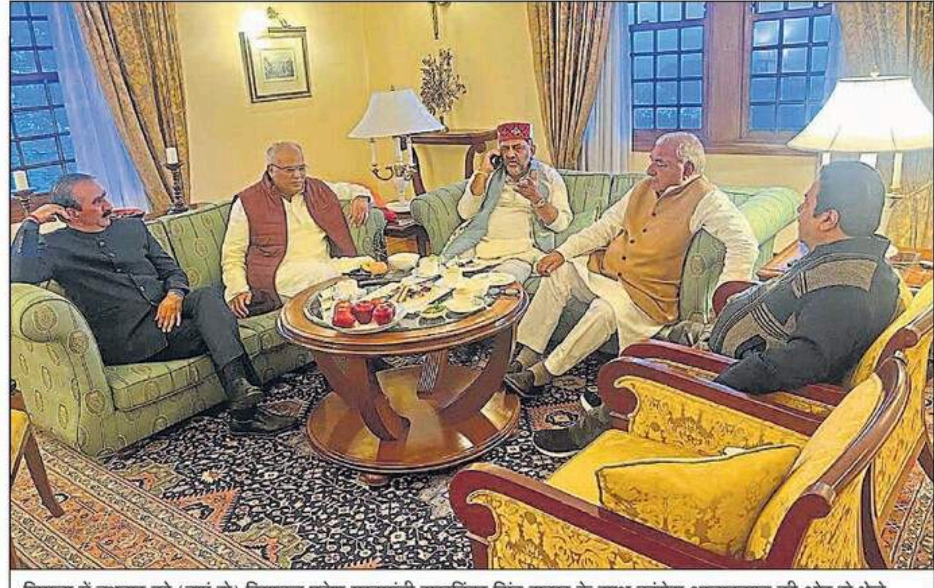
शिमला में बुधवार को (बाएं से) हिमाचल प्रदेश मुख्यमंत्री सुखू सिंह सुखू के साथ कांग्रेस आलाकमान की ओर से भेजे गए पर्यवेक्षक भूपेश बघेल, डीके शिवकुमार, भूपेंद्र सिंह हुड्डा। साथ में हैं राजीव शुक्ला।

नई दिल्ली, विशेष संवाददाता। हिमाचल प्रदेश में मुख्यमंत्री सुखू सिंह सुखू की मुश्किलें बढ़ गई हैं। राज्यसभा चुनाव में पार्टी विधायकों की क्रॉस वोटिंग के बाद प्रदेश सरकार में मंत्री विक्रमादित्य सिंह के इस्तीफे से सरकार की स्थिरता को खतरा पैदा हो गया है। हालात की नजाकत को समझते हुए पार्टी ने पूर्व मुख्यमंत्री भूपेंद्र सिंह हुड्डा और कर्नाटक सरकार में उप मुख्यमंत्री डीके शिवकुमार को शिमला भेजा है। ये दोनों पर्यवेक्षक सभी विधायकों से बातकर गुरुवार शाम तक अपनी रिपोर्ट देंगे।