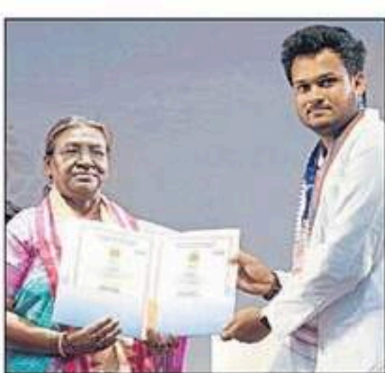
रांची में बुधवार को सीयूजे के दीक्षांत समारोह के दौरान राष्ट्रपति द्रौपदी मुर्मू।

मुर्मू ने कहा कि युवा भारत के सबसे बड़े संसाधन और सबसे बड़ी पूंजी हैं। भारत, विश्व की सबसे अधिक युवा आबादी वाले देशों में से एक है। भारत की अर्थव्यवस्था आज विश्व में पांचवें स्थान पर है। वर्ष 2030 तक हम तीसरी