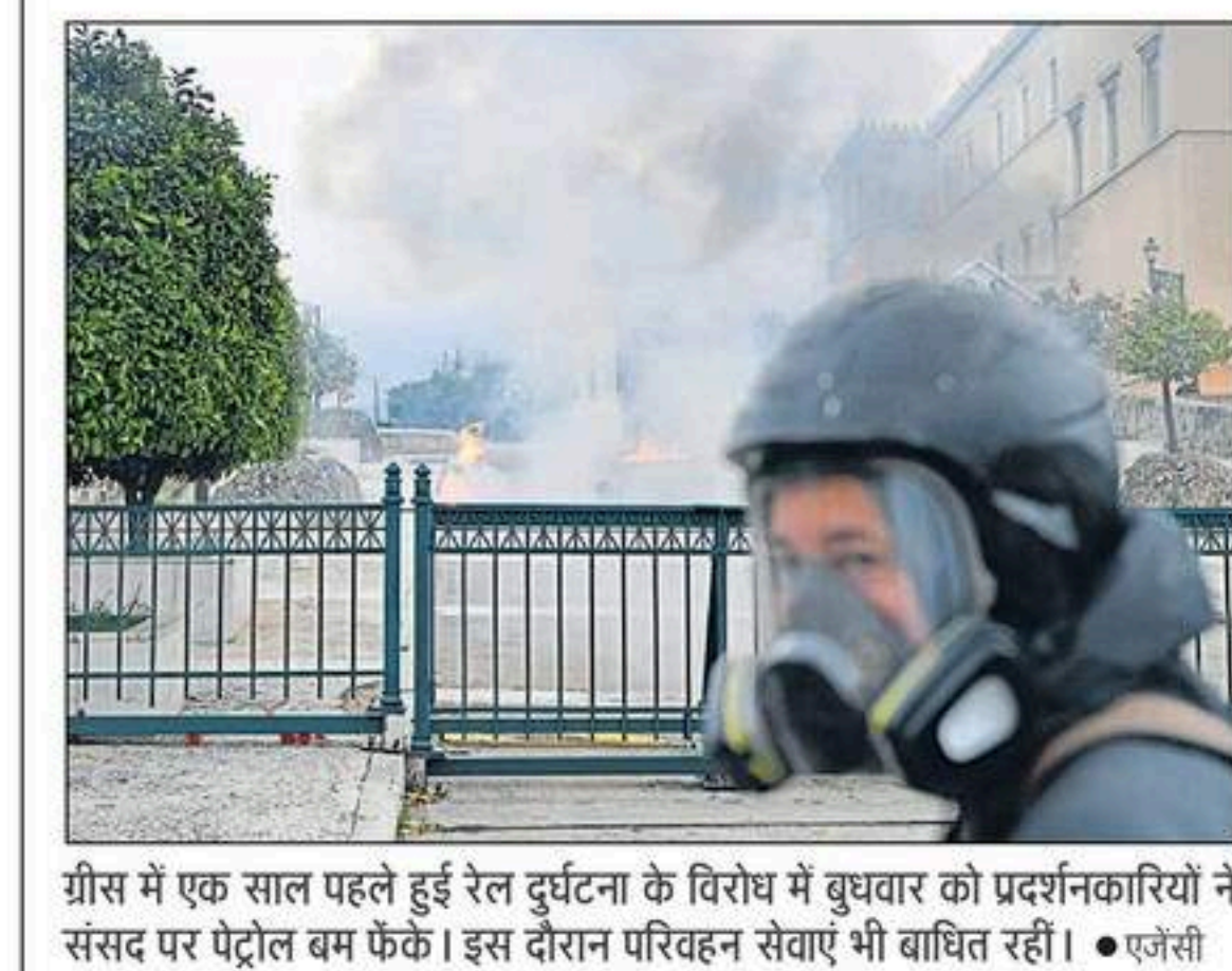
ग्रीस में एक साल पहले हुई रेल दुर्घटना के विरोध में बुधवार को प्रदर्शनकारियों ने संसद पर पेट्रोल बम फेंके। इस दौरान परिवहन सेवाएं भी बाधित रहीं।

लाहौर। पाकिस्तान में हुए चुनावों में इमरान की पार्टी द्वारा लगाए गए घांघली के आरोपों के कुछ और सबूत सामने आए हैं। सोशल मीडिया पर दो नेताओं के ऐसे ऑडियो क्लिप वायरल हो रहे हैं, जिसमें बड़े पैमाने पर घांघली और जनादेश चोरी किए जाने की बात हो रही है। ये ऑडियो क्लिप मुताहिदा कोमी मुवमेंट-पाकिस्तान (एमक्यूएम-पी) के नेता और सिंध गवर्नर कामरान तेसरी के हैं। ऑडियो में तेसरी कह रहे हैं कि हमारा जनादेश पूरी तरह से फर्जी है।