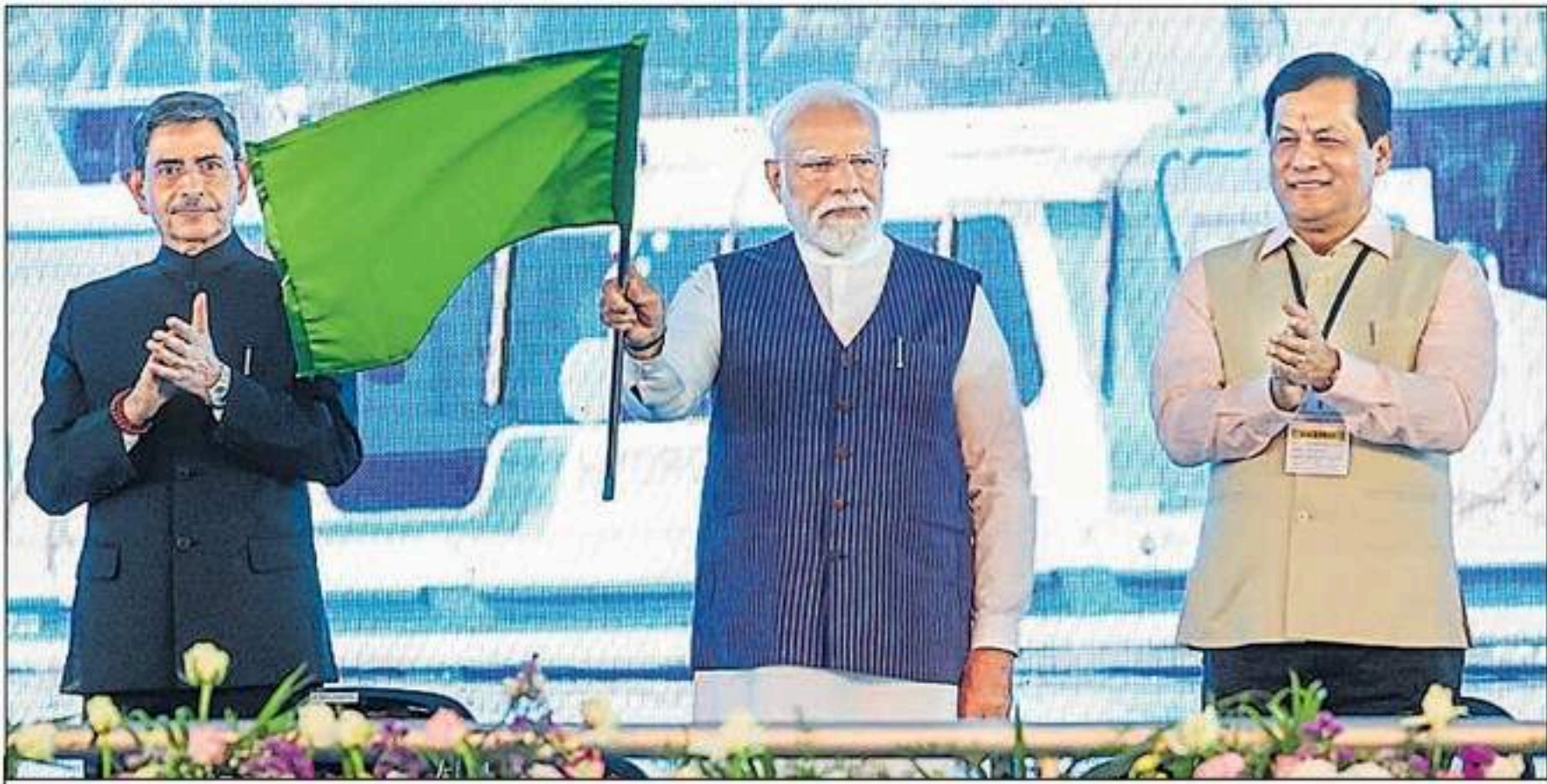
तमिलनाडु के थूथुकुडी में बुधवार को पहले स्वदेशी हरित हाइड्रोजन पोत को हरी झंडी दिखाते प्रधानमंत्री नरेंद्र मोदी। साथ में तमिलनाडु के राज्यपाल आरएन रवि और केंद्रीय मंत्री सर्वानंद सोनोवाल।

थूथुकुडी, एजेंसी। प्रधानमंत्री नरेंद्र मोदी ने बुधवार को तमिलनाडु में लगभग 17,300 करोड़ रुपये की नई परियोजनाओं का उद्घाटन और शिलान्यास किया। मोदी ने कहा कि नई परियोजनाएं विकसित भारत की रूपरेखा का एक महत्वपूर्ण हिस्सा हैं। प्रधानमंत्री नरेंद्र मोदी ने थूथुकुडी के निकट कुलसेकरापेटिनम में भारतीय अंतरिक्ष अनुसंधान संगठन (इसरो) के नए प्रक्षेपण परिसर का शिलान्यास किया, जिसकी लागत लगभग 986 करोड़ रुपये है। इसके बनकर तैयार होने पर यहां से प्रतिवर्ष 24 प्रक्षेपण किए जा सकेंगे। इसरो के इस नए परिसर में मोबाइल लॉन्च स्ट्रक्चर तथा 35 केन्द्र शामिल हैं। इससे अंतरिक्ष अन्वेषण क्षमताओं को बढ़ाने में मदद मिलेगी। मोदी ने वीओ चिदंबरनार बंदरगाह के लिए बाहरी हाबर् कंटेनर टर्मिनल की आधारशिला रखने के बाद कहा इस परियोजना में लगभग 7,000 करोड़ रुपये की राशि का निवेश किया जाएगा। प्रधानमंत्री नरेंद्र मोदी ने तमिलनाडु में रेल परियोजनाएं भी राष्ट्र को समर्पित कीं। इसमें वांची मिनियाच्ची-नागरकोइल रेल लाइन का दोहरीकरण शामिल है।