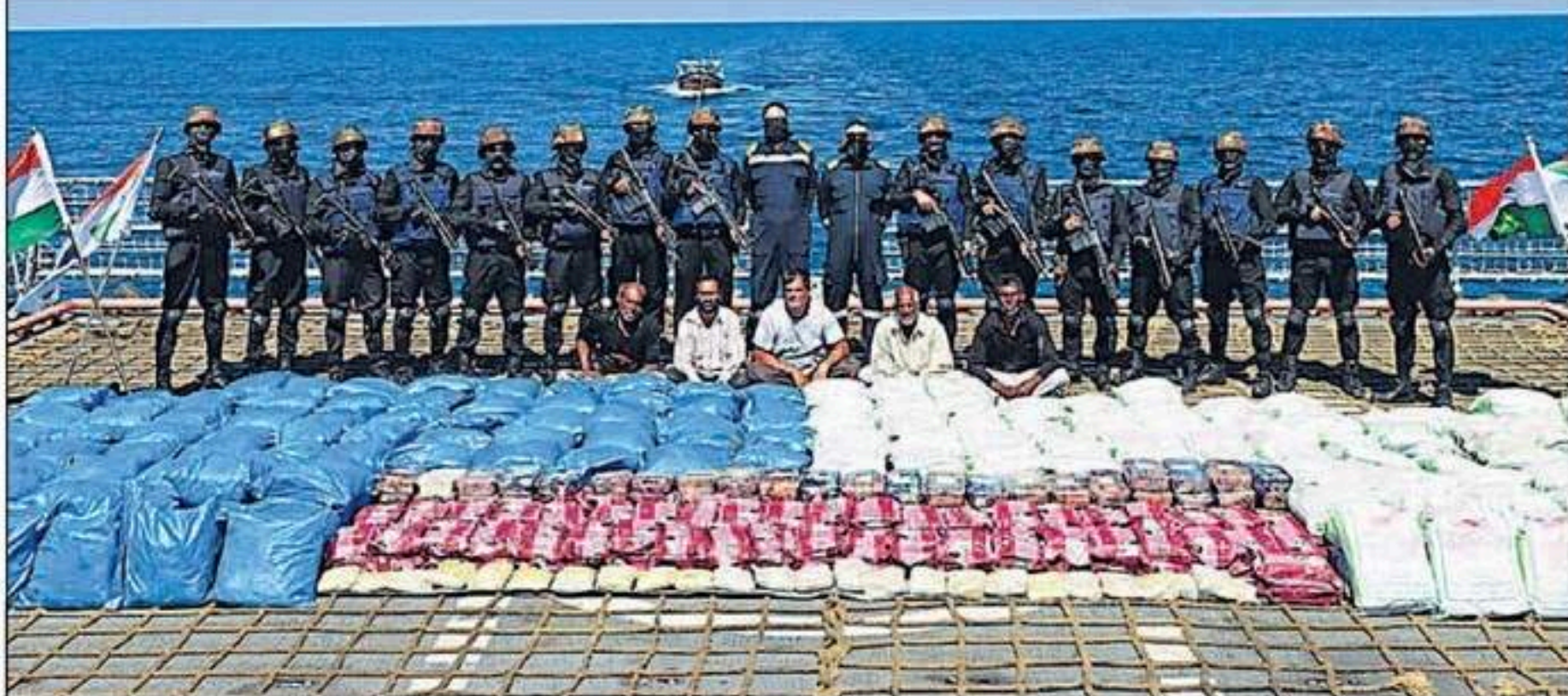
अरब सागर में ऑपरेशन 'सागरमंथन-1' के तहत भारी मात्रा में मादक पदार्थ जब्त करने के साथ आरोपी भी पकड़े गए।

गृह मंत्री अमित शाह ने कार्रवाई के संबंध में एक्स पर पोस्ट में कहा, प्रधानमंत्री के नशामुक्त भारत के सपने को बढ़ाते हुए हमारी एजेंसियों ने मादक पदार्थों की सबसे बड़ी जब्त की है।