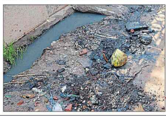
उपराज्यपाल ने पोस्ट में लिखा कि मुख्यमंत्री दिल्लीवासियों की समस्या पर ध्यान दें। सोिएप के संज्ञान में समस्या को डालने के लिए उपराज्यपाल ने संगम विहार की कई तस्वीरें ट्वीट की हैं। इनमें टूटी सड़के, जगह-जगह फैला हुआ कूड़ा और नाले से बह रहे पानी की तस्वीरें शामिल हैं।

नई दिल्ली, प्रमुख संबाददाता। उपराज्यपाल वीके खरसेना ने सोमवार को दक्षिण दिल्ली के संगम विहार इलाके का निरीक्षण किया। इस दौरान उन्होंने सोशल मीडिया मंच 'एक्स' पर पोस्ट कर टूटी सड़के और गंदगी को लेकर नाराजगी जताई। उन्होंने सरकार को नसीहत देते हुए कहा कि इलाके में बुनियादी सुविधाओं का अभाव है। इससे पूर्व, एलजी ने अधिकारियों के साथ कई ब्लॉक का पैदल दौरा किया। इसकी जानकारी उन्होंने पोस्ट कर दी। उपराज्यपाल ने दिल्ली सरकार पर निशाना साधते हुए लिखा, 'स्थानीय निवासियों के अनुरोध पर वह संगम विहार गए थे। वहां रह रहे 20 लाख से ज्यादा लोग मूलभूत जनसुविधाओं से वंचित हैं और नारकीय जीवन जीने को मजबूर हैं। वहां न सड़के हैं, न सौंवर, न कूड़े की सफाई। उपराज्यपाल ने पोस्ट में लिखा कि मुख्यमंत्री दिल्लीवासियों की समस्या पर ध्यान दें। सोिएप के संज्ञान में समस्या को डालने के लिए उपराज्यपाल ने संगम विहार की कई तस्वीरें ट्वीट की हैं। इनमें टूटी सड़के, जगह-जगह फैला हुआ कूड़ा और नाले से बह रहे पानी की तस्वीरें शामिल हैं।