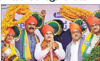
बेल्गावी में मंगलवार को जेपी नड्ड को माना एहताम पार्टी के नेता।

चिकोडी (कर्नाटक), एजेसी। भाजपा के राष्ट्रीय अध्यक्ष जेपी नड्ड ने पाकिस्तान समर्थक नारे के मुद्दे पर कर्नाटक की कांग्रेस सरकार पर मंगलवार को जोरदार हमला बोला।