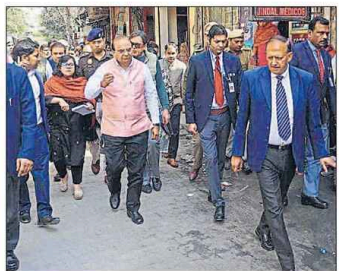
नई दिल्ली के संगम विहार में निरीक्षण करते उपराज्यपाल वीके खरसेना।