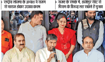
नई दिल्ली में मालविक को बेशर्माता करते राष्ट्रीय लोजपा नेताओं की प्रमुख पुरुषी कुमार पारस।

राष्ट्रीय लोजपा के अध्यक्ष परभूति कुमार पारस ने मंगलवार को केंद्रीय मंत्री पद से इस्तीफा दे दिया। राजग में हिस्सेदारी नहीं मिलने से पारस राजग में रहे। प्रधानमंत्री नरेंद्र मोदी को भेजे अपने त्यागपत्र में पारस ने राजग से संबंध तोड़ने के बारे में कुछ उल्लेख नहीं किया है। दो बच्चों के इस्तीफे में उन्होंने अपने ऊपर किए गए विकास के प्रति संतुलित राश्ट्रीय प्रशासनिक मंत्री के प्रति आभार भी जताया है, जो बताया है कि पारस ने विकल्प अभी बचाकर रखा है। हालांकि वह राजद के संकेत में हैं और हाजीपुर राईट से पिराग पासवान के विरुद्ध चुनाव लड़ सकते हैं। दिल्ली में अपने सरकारी आवास पर प्रेस कॉन्फ्रेंस में पारस ने कहा - मैं बड़े इमानदारी के साथ राजग में रहा। प्रधानमंत्री मोदी बड़े नेता हैं, लेकिन हमारी पार्टी को व्यक्तिगत रूप से मेरे साथ नहीं है। इसलिए मैं पारस 2019 में हाजीपुर राईट से लोकसभा चुनाव लड़कर संसद बने थे। बाद रामविलास पासवान के निधन के बाद उन्होंने लोजपा