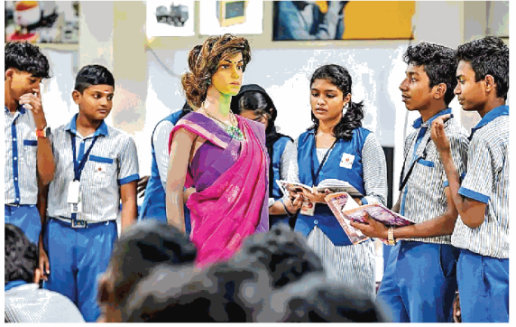
तिरुवनंतपुरम के एक स्कूल में छात्रों से संबन्धित 'आइरिस' नामक एआइ शिक्षिका।

पिछले दिनों भारत को पहली एआइ शिक्षिका मिली। केरल के तिरुवनंतपुरम के एक स्कूल में पेश की गई इस रोबोट शिक्षिका का नाम 'आइरिस' है।