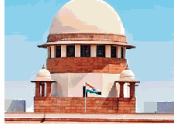
श्रीष अदलत का महकवतनी निदेश।

नई दिल्ली, ढुः सुप्रमि केंद्र में मंगलवार को सचिव राश्यों और केंद्र शासित प्रदेशों को दिनांक दिया कि जो महीने के अंदर प्रवासी श्रमिकों को राशन कार्ड उपलब्ध कराया जाएगा। यह वह श्रमिक हैं जो विभिन्न सरकारी योजनाओं का लाभ लेने के लिए 5-10 मघ पीएल पर पंजीकृत हैं।