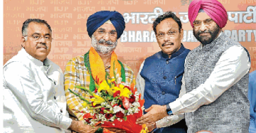
अमेरिका में भारत के पूर्व राजदूत तत्कालीन सिंह संघु मंगलवार को नई दिल्ली में भाजपा के वरिष्ठ नेता राजग गुण, निजि तावड़े उपाध्यक्ष विजय शिरवा की उपस्थिति में शामिल हो गए।

नई दिल्ली, एएनआई: अमेरिका में भारत के राजदूत रहें तत्कालीन सिंह संघू मंगलवार को भाजपा में शामिल हो गए। उन्हें पंजाब के अमृतसर से लोकसभा चुनाव में उतारा जा सकता है। उन्होंने पार्टी महामंडली विनोद तावड़े और महाराष्ट्र की मौजूदगी में भाजपा की सदस्यता ली। इस दौरान संघु ने भारत-अमेरिका संबंधों को मजबूती के बारे में बात की और कहा कि सीमांकित उद्योग जैसे कुछ क्षेत्रों में खास ध्यान दिया गया है। उन्होंने कहा कि दोनों देशों के बीच संबंधों को मजबूत करने में मदद गारू है जो दोनों के लिए लाभदायक है। उन्होंने इस बात पर जोर दिया कि इसका ताला रोगरार के अमेरिकी और विकास के मामले में अमृतसर प्रवेश के विभिन्न संघु के लिए पड़ना चाहिए। उन्होंने कहा, विच्छेद 10 वर्षों में मैं पण मारो के नेतृत्व में मिलकर बना किया है, खासकर अमेरिका में श्रमिकों के साथ संबंधों के मामले में। तावड़े ने कहा कि संघु जैसे फरफल कट्टीवादी प्रभुपति वहां व्यक्ति को मजबूती से पीछे मजबूत लगे। संघु के पिता बिजान सिंह समुंद्री प्रसिद्ध शिक्षाविद