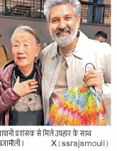
राजामौली के लिए जापानी महिला से मिले उपहार अमूल्य

राजामौली के लिए जापानी महिला से मिले उपहार अमूल्य राजामौली के लिए जापानी महिला से मिले उपहार अमूल्य