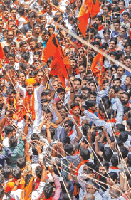
भेगलुरु में अदलत के नाम पर केंद्र हुए दुकानदार की विचारों पर सोमवार को प्रदर्शन आयोजित।

भेगलुरु में अदलत के नाम पर केंद्र हुए दुकानदार की विचारों पर सोमवार को प्रदर्शन आयोजित। घटना के विरोध में मंगलवार को वहाँ बड़ी संख्या में लोगों ने प्रदर्शन किया।