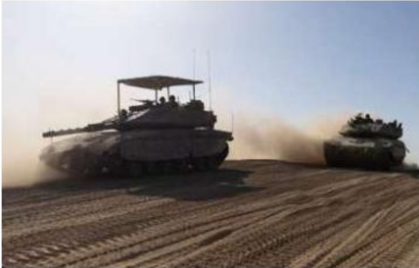
निरंतर निगराना: एक इजरायली टैंक और एक बख्तरबंद कार्मिक वाहक दक्षिणी इजराइल में सीमा के साथ आगे बढ़ें।