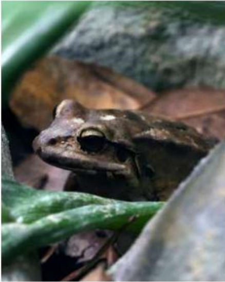
लीफ लिटर में एक अल्ट्रासोनिक ध्वनियाँ उत्सर्जित करता है जो मनुष्यों के लिए अश्रव्य होती है लेकिन शिकारियों को डरा सकती है।