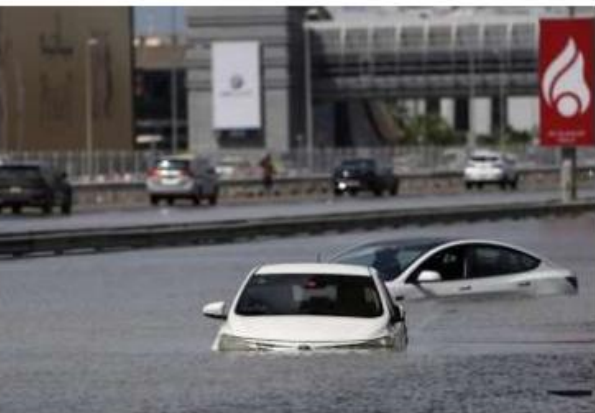
दुबई में भारी बारिश के कारण बाढ़ के पानी में फंसी कारें बुधवार को संयुक्त अरब अमीरात।

"यह सबसे अधिक में से एक था मैंने कभी भी भयावह स्थितियों का अनुभव किया है, क्योंकि में मुझे पता था कि अगर मेरी कार खराब हो गई नीचे, यह डूब जाएगा और मैं इसके साथ डूब जाऊंगा, "कहा 30 वर्ष की आयु का एक कार्यकर्ता, जो