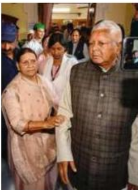
बिहार की पूर्व मुख्यमंत्री राबड़ी देवी और लालू प्रसाद रंगे कुछ दिनों के लिए सारण

उम्मीदवार, लेकिन बुधवार को श्री प्रसाद, अपनी पत्नी के साथ और पूर्व सीएम राबड़ी देवी, सारण चले गए, जहां वे के लिए शिबिर लगाने की उम्मीद है दो-तीन दिन, सुश्री आचार्य हैं के खिलाफ सीधे मुकाबले में बीजेपी सांसद राजीव प्रताप रूडी, कई बीजेपी और जनता दल (ए) नेताओं ने श्री की आलोचना की थी। प्रसाद को भाग नहीं लेने के लिए दोषी ठहराया उनकी पार्टी का अभियान। अपने अभियान में, सुश्री, आचार्य ने लगातार सारण में बदलाव पर जोर दिया, और को पूरा करने का बचन दिया है उसके पिता का काम.