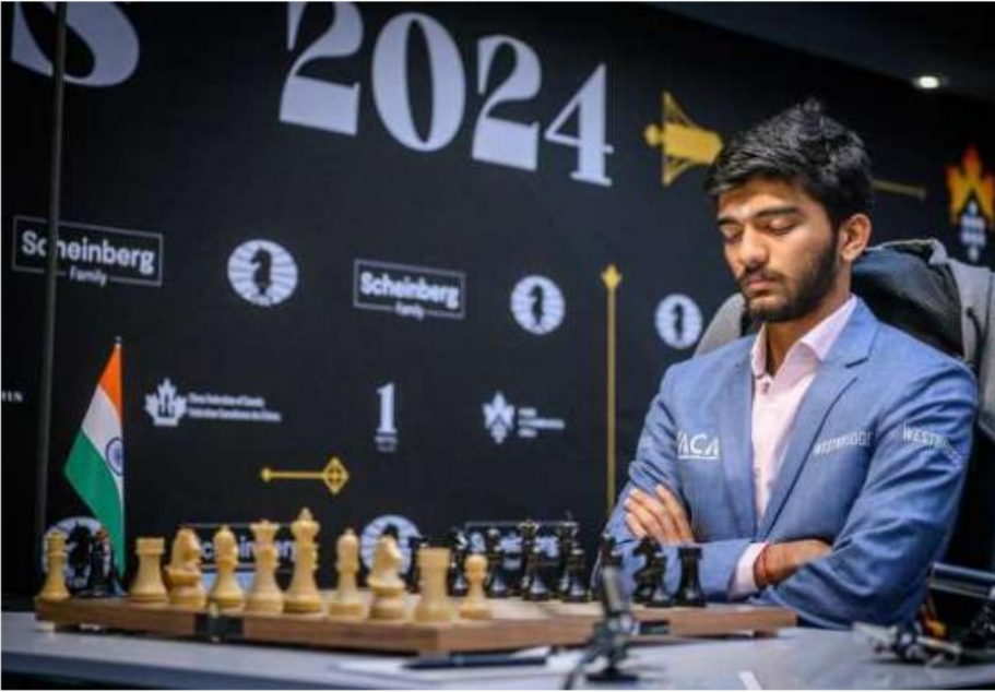
अपना सब कुछ देते हुए: गुकेश का नेपोनियाचची के साथ ड्रा बुद्धिमान शुरुआती चयन पर आधारित था।

फैबियानो कारुआना हिकासू के खिलाफ अच्छा खेल रहे थे