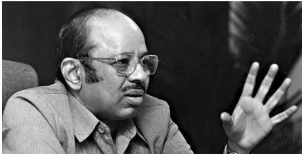
एक्स विजुअल प्रश्न: पांच बार के संसद सदस्य और उन्होंने जिस पार्टी का प्रतिनिधित्व किया, उसे पहचानें। हिंदू पुराण

प्रश्न 5 तमिलनाडु में 1998 और 1999 में तिरुचिरापल्ली से भारतीय जनता पार्टी के टिकट पर चुने गए कुछ सांसदों में से एक, उन्होंने उस अवधि के दौरान भाजपा के नेतृत्व वाली सरकारों में केंद्रीय मंत्री के रूप में भी कार्यभार संभाला। उसका नाम बताओ।