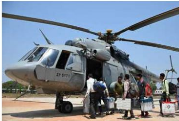
ईबीएम और अन्य मतदान सामग्री ले जाने वाले अधिकारी एक विमान में सवार होते हैं बुधवार को छत्तीसगढ़ के सुकमा में एक मतदान केंद्र के लिए रवाना हुए।

और नवादा. 38 हैं मैदान में प्रतियोगी, गया में सबसे अधिक 14 उम्मीदवार हैं। पार्टी अध्यक्ष और पूर्व मुख्यमंत्री जीवन राम मांझी मैदान में हैं महागठ के खिलाफ-