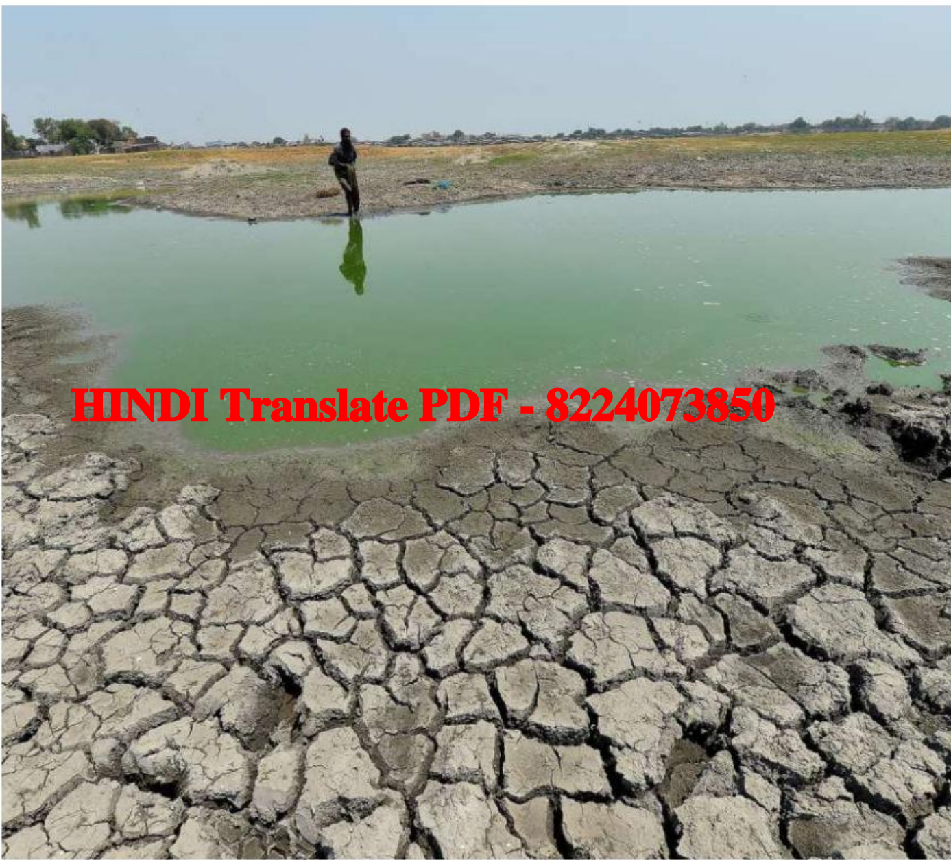
सूखी भूमि: 9 अप्रैल को अहमदाबाद में चंदोला झील पर एक स्थानीय मछुआरा। विजय सौनी

एचएपी आम तौर पर हीटवेव के बारे में जनता और संबंधित अधिकारियों को सचेत करने के लिए पूर्वनिर्माण और प्रारंभिक चेतावनी प्रणालियों का उपयोग करने, अभियानों के माध्यम से जनता को शिक्षित करने जैसे उपायों के संयोजन का सुझाव देते हैं।