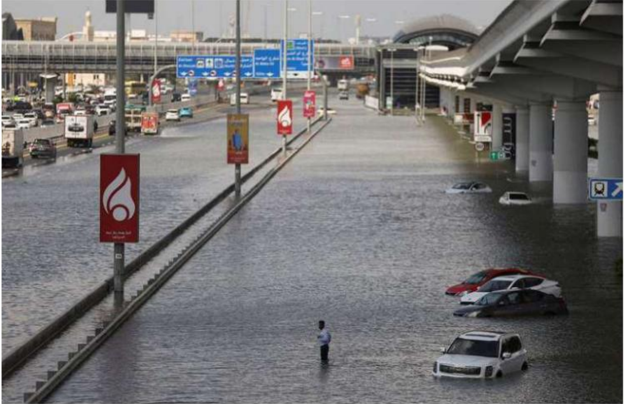
बाढ़ग्रस्त रंगिस्तान: मंगलवार को भारी बारिश के बाद दुबई की एक सड़क पर पानी भर गया। सेंटपर्स (पेज 14 पर रिपोर्ट)