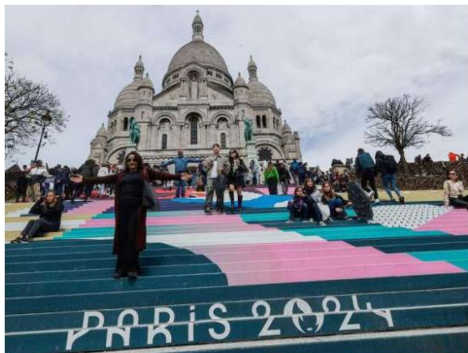
तेयार हो रहे हैं: लोग पेरिस में मॉंटमार्टू पहाड़ी की चोटी पर सैकड़ों बेसिलिका के सामने आगामी पेरिस 2024 ओलंपिक के रंग में रंगी सीढ़ियों से नीचे चल रहे हैं।

यह विचार कि 26 जुलाई-11 अगस्त के खेल और 28 अगस्त-8 सितंबर के पैरालिंपिक से पेरिस के उत्तर-पूर्व में सीन-सेंट-डेनिस क्षेत्र में स्थित समुदायों को लाभ मिलना चाहिए, सीन-सेंट-डेनिस के बच्चों के लिए जो नस्लीय भेदभाव का सामना कर रहे हैं और अन्य बाधाएँ, खेल कभी-कभी बाहर निकलने का रास्ता होते हैं। विश्व कप विजेता क्रिस्तिन एम्बाये ने बॉडी के सीन-सेंट-डी-निस शहर में एक लड़के के रूप में अपने रथनी फुटबॉल कोचाल को निचारा।