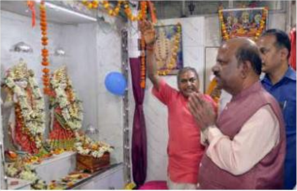
पश्चिम बंगाल के राज्यपाल सीबी आनंद बोस हनुमान की पूजा करते हुए रामनवमी पर कोलकाता में मंदिर.

चुनाव आयोग के सूत्रों ने यह बात कही आयोग को लगा कि वहाँ था कोई "तत्काल ज्ञात" नहीं राज्यपाल के लिए आवश्यकता-