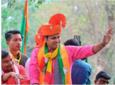
ग्राउंड ज़ीरो: त्रिपुरा के पूर्व मुख्यमंत्री और भाजपा उम्मीदवार बिप्लव कुमार देब लोक के लिए प्रचार कर रहे हैं त्रिपुरा में विधानसभा चुनाव

की राजनीति धर्म, भाषा और जातियाँ ऐसा करती हैं में जगह नहीं है लोकतंत्र जो है द्वारा शासित संविधान असम के सहित कांग्रेस नेता