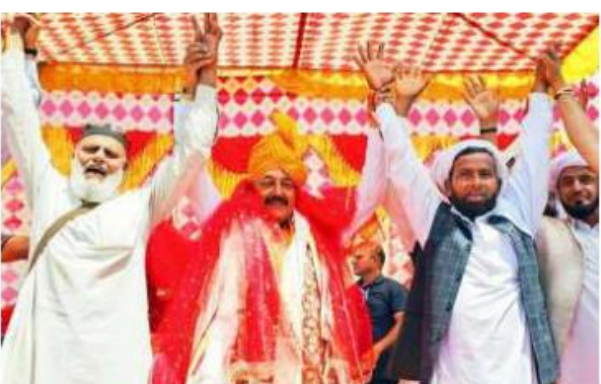
हाई-ऑक्टैव मुकाबला: केन्द्रीय मंत्री और उधमपुर-कडुआ सीट से भाजपा उम्मीदवार जितेंद्र सिंह एक सार्वजनिक बैठक के दौरान (बाएं), और कडुआ में एक रैली को संबोधित करते कांग्रेस प्रत्याशी चौधरी लाल सिंह।

जिस पर एक बार उनकी अपेक्षित जताई गई थी राहुल की भा-रात जोड़ो यात्रा रैली के दौरान मोज़ुदगी गांधी अपने अतीत के कारण. सितारों से सज्जित अभियान प्रधानमंत्री से लेकर केन्द्रीय गृह मंत्री अमित शाह, रक्षा मंत्री राजनाथ सिंह और उत्तर प्रदेश के मुख्यमंत्री योगी आदित्यनाथ के नेतृत्व में कैम्प-पैन को रोशन किया गया था बीजेपी के शीर्ष नेताओं द्वारा. सभी उनमें से पर ध्यान केंद्रित किया है वे जो कहते हैं वही फलदायी होता है का जम्मू-कश्मीर पर असर केंद्र का निर्णायक अंत 2019 में पूर्ववासी राज्य को विशेष दर्जा। "राम राज्य पहले ही आ चुका है शुरू हुआ और सुनिश्चित CI-