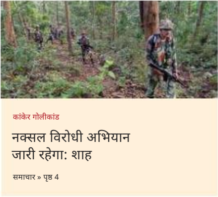
कांकिर गौलीकांड नक्सल विरोधी अभियान जारी रहेगा: शाह समाचार > पृष्ठ 4