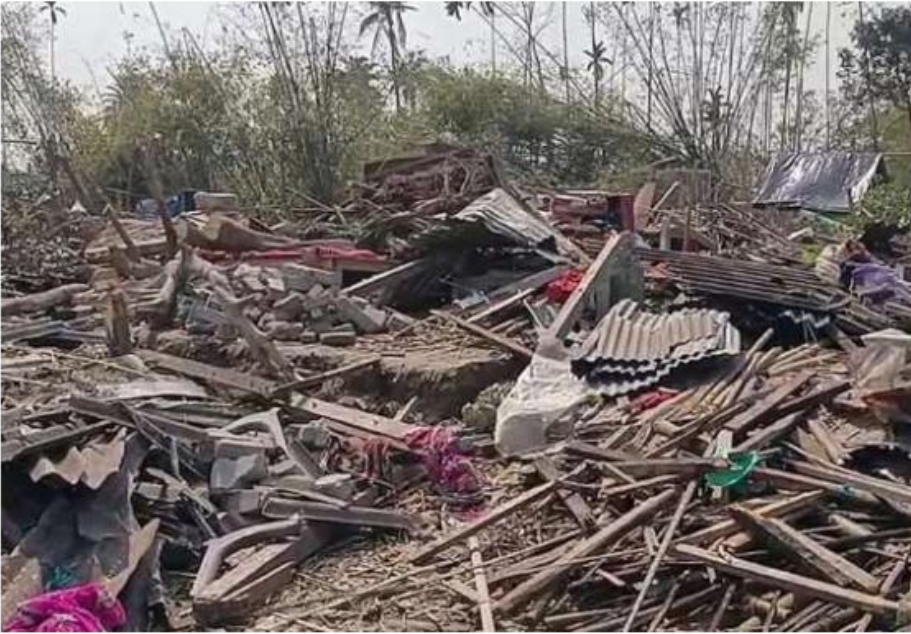
मलबे में तब्दील: 2 अप्रैल को जलपाईगुड़ी जिले में 'मिनी-बवंडर' से मकान ढह गए।

चुनावी रणियों में चलता है और सोशल मीडिया पर, पर