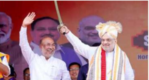
केंद्रीय गृह मंत्री अमित शाह के साथ मणिपुर के सीएम बीरेन सिंह 15 अप्रैल को इंपाल में एक अभियान रैली के दौरान

पिछले मई में विस्फोट हुआ। अब तक, 220 से अधिक लोग हो चुके हैं मारे गए, हजारों घायल हुए, और हजारों लोग विस्थापित हुए। घबराव था