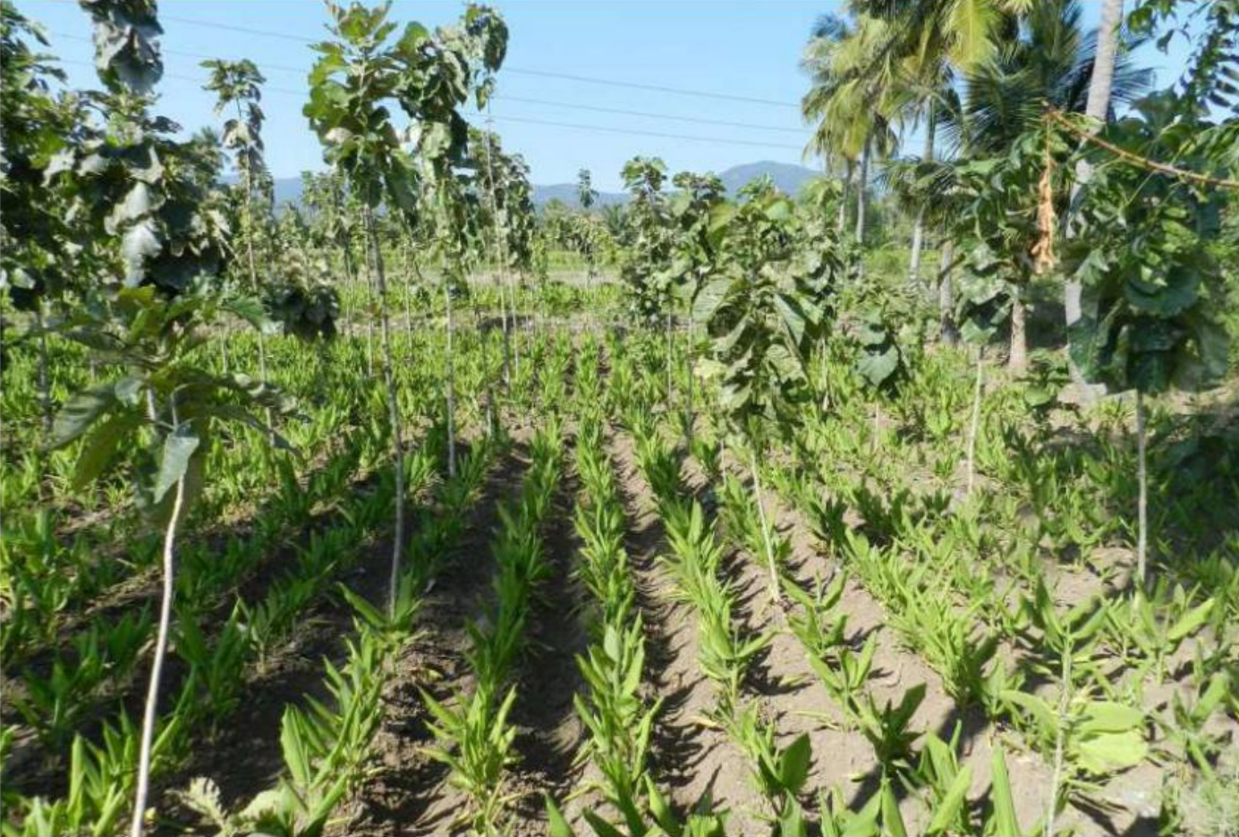
कोयंबटूर के एक कृषि वानिकी फार्म में सागौन और हल्दी एक साथ उगाए गए। हिन्दू

सही देशी प्रजातियों की खोज कृषि मंत्रालय ने 2014 में राष्ट्रीय कृषि वानिकी नीति का मसौदा तैयार करते समय पानी की उपलब्धता को एक चुनौती के रूप में पहचाना। फिर भी समस्या प्रासंगिक बनी हुई है और छोटे किसानों के लिए विशेष रूप से गंभीर है, जिन्हें पानी सुरक्षित करने के लिए अतिरिक्त धन की आवश्यकता होती है और/या जिन पर अतिरिक्त कर्ज होता है। ऐसा करने में। इसके अलावा, पौधे के उगने के चरण के दौरान पानी की उपलब्धता महत्वपूर्ण है, लेकिन अगर पेड़ पानी के लिए फसलों के साथ प्रतिस्पर्धा करते हैं तो यह लगातार चिंता का विषय बना रहता है