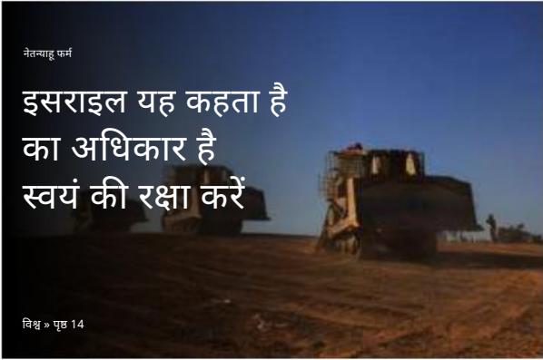
नेतृत्वपूर्ण इसराइल यह कहता है का अधिकार है स्वयं की रक्षा करें विश्व > पृष्ठ 14