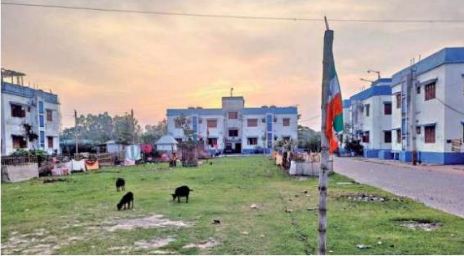
कोई राहत नहीं: कूच बिहार जिले के दिनहाटा में अपार्टमेंट परिसर जहां पूर्ववासी एन्क्लेव था निवासियों का पुनर्वास किया गया है। शिव सहाय सिंह

दिनहाटा में, एक बड़ी बस्ती बसी हुई थी दो मजिला परिसर ब्लॉक, बहुत कुछ नहीं देखा है लोकसभा चुनाव से पहले राजनीतिक गतिविधियाँ. तुर्का-मूल कांग्रेस के झंडे रहे हैं में कुछ स्थानों पर लगाए गए बस्ती परिसर, लेकिन प्रमुख से नेता