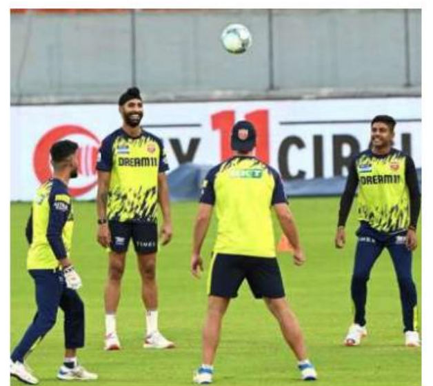
उप-कप्तानः एमआई की प्रसिद्ध बल्लेबाजी लाइन-अप के खिलाफ पीबीकेएस का अच्छा गेंदबाजी आक्रमण एक दिलचस्प लड़ाई का कारण बनेगा।

मुंबई को उम्मीद देगा। दूसरी ओर, पुन-जन्म अपने शीर्ष क्रम के खराब फॉर्म से चिंतित होगा और उसके शीर्ष स्कोरर और कप्तान शिखर धवन अभी भी जुरी में कंधे से कंधा मिलाकर चल रहे हैं, इससे मेजबान की चिंताएं और बढ़ जाएंगी।