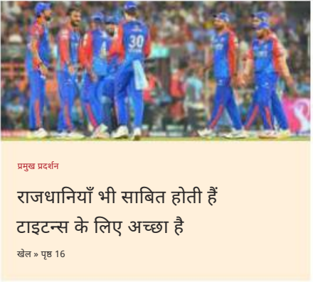
प्रमुख प्रदर्शन राजधानियाँ भी साबित होती हैं टाइटन्स के लिए अच्छा है खेल > पृष्ठ 16