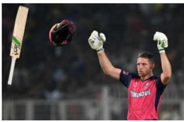
चुंबकीय खिंचावः बटलर के पास असंभव को खींचने की क्षमता है, जैसा उन्होंने मंगलवार को ईडन गार्डन्स में कैकेआर के खिलाफ किया था।

103 बनाम कैकेआर, मुंबई (बैरोन): 61 गेंदों की पारी, जिसमें नौ चौके और पांच छक्के शामिल थे, ने रॉयल्स को 217 रन बनाने में महत्वपूर्ण भूमिका निभाई, नाइट राइडर्स ने सात रन कम होने से पहले लगभग ड्रवकी बराबरी कर ली। 116 बनाम डीसी, मुंबई (वानखेड़े): बटलर थे