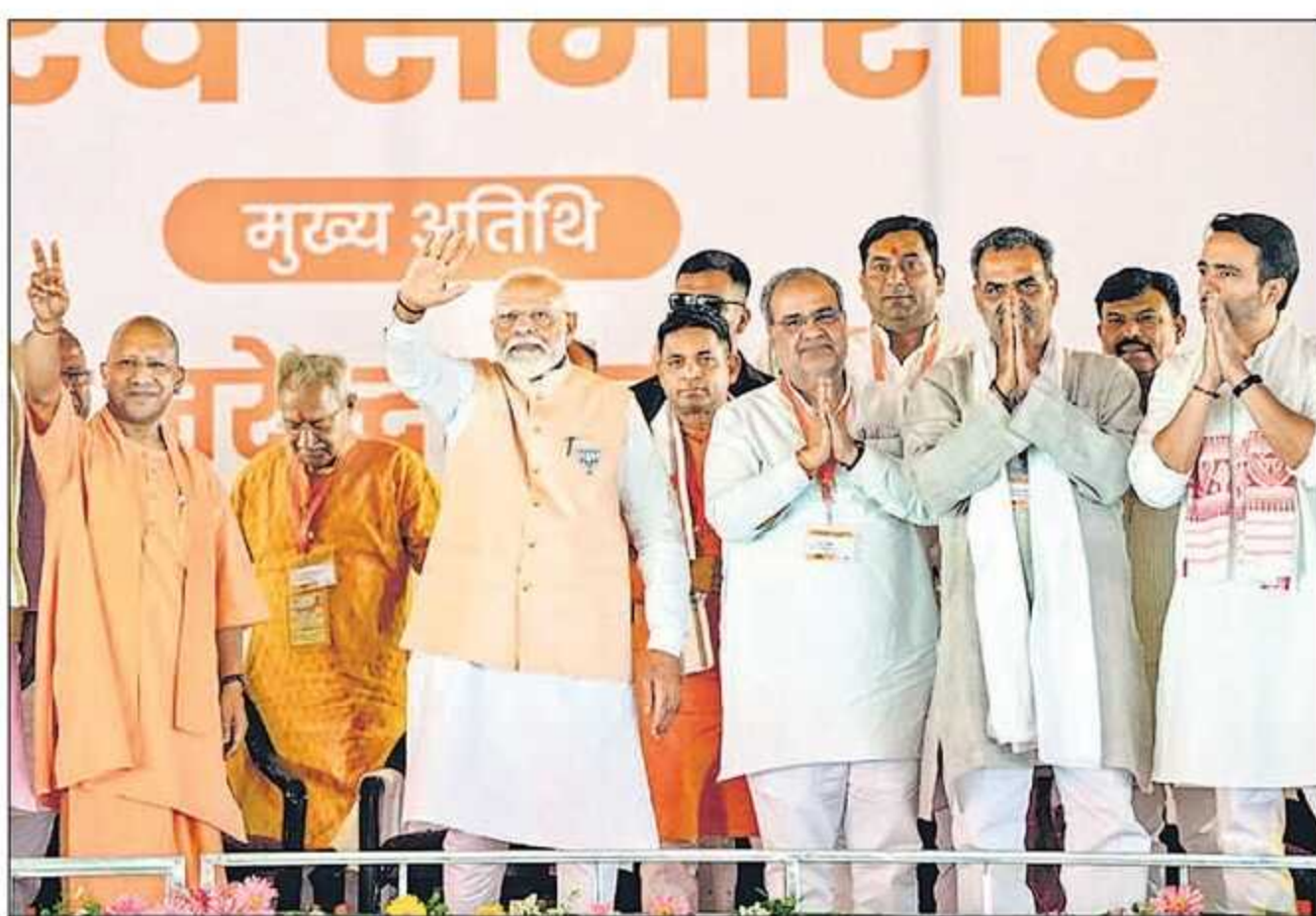
मेरठ में रविवार को प्रधानमंत्री नरेंद्र मोदी के साथ मुख्यमंत्री योगी आदित्यनाथ, रालोद अध्यक्ष जयंत चौधरी समेत अन्य नेता।

मेरठ, प्रमुख संवाददाता। प्रधानमंत्री नरेंद्र मोदी ने रविवार को मेरठ में भारत रत्न चौधरी चरण सिंह गौरव समारोह से चुनावी शंखनाद किया। इस दौरान उन्होंने विपक्ष पर तीखा प्रहार करते हुए कहा, भ्रष्टाचार के खिलाफ कार्रवाई हो रही है तो कुछ लोग बौखला गए हैं। भ्रष्टाचार के खिलाफ मेरी लड़ाई जारी रहेगी। भ्रष्टाचार चाहे कितना भी बड़ा क्यों न हो, कार्रवाई होगी, जरूर होगी। प्रधानमंत्री मोदी ने मेरठ से वर्ष 2014 और 2019 की तरह चुनावी आगाज करते हुए पूर्व प्रधानमंत्री चौधरी चरण सिंह से लेकर गन्ना किसानों तक का जिक्र कर पश्चिमी यूपी को साधा। मोदी ने विपक्षी दलों के समूह 'इंडिया' पर भ्रष्टाचार और भ्रष्टाचारियों को संरक्षण देने का आरोप लगाया। उन्होंने कहा, जिसने देश लूटा है, उसे लौटाना ही पड़ेगा, यह मोदी की गारंटी है।